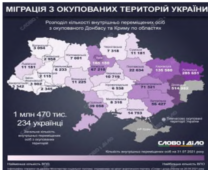
Рис. 1 Розподіл кількості внутрішньо переміщених осіб на 31.07.2021