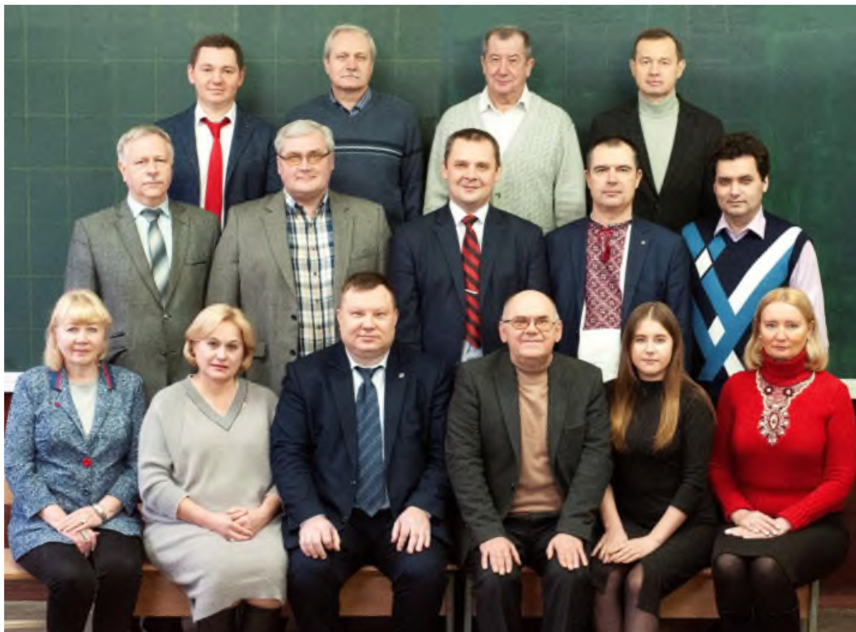
Склад кафедри, 2022 рік