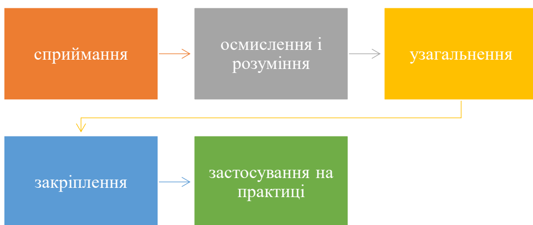
Рис. 1. Процес засвоєння знань здобувачем

Як відомо, процес засвоєння знань складається з певних ланок, які схематично подано на рис. 1.